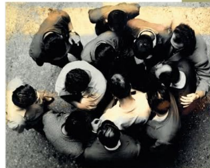
Gorgona gleda u zemlju, 1961.

Razumijevanje kulturne baštine neslaganja u bivšim socijalističkim državama