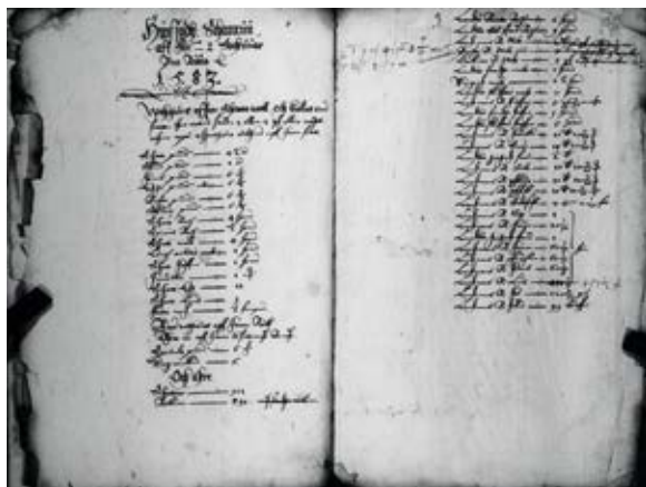
Kansallisarkisto (Finland): Sekalaisia tileja 1500-1500 (324) / Voudintilit [Razni računi / Stara zbirka računa, 1539-1634.],

APEX konzorcij obuhvaća predstavnike arhivskih ustanova iz 32 europske države i Međunarodni centar za arhivska istraživanja (ICARUS) koji su usmjereni na uključivanje što više europskih institucija kojima će pomoći u prikupljanju podataka na nacionalnoj razini. Aktivnosti partnera prvenstveno su usmjerene na proširivanje, produbljanje i unaprjeđenje inicijativa i aktivnosti vezanih uz razvoj Europskog arhivskog portala, a APEX aktivno surađuje s Europeanom na interoperabilnosti i standardima te pravnim pitanjima vezanima uz arhivsko gradivo, s krajnjim ciljem omogućivanja pristupa što većoj količini arhivskog gradiva iz država članica EU za što više korisnika, na što lakši i jednostavniji način.