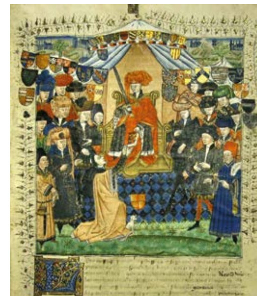
Nationaal Archief (Nizozemska): Remissorium Philippi, index op de grafelijke registers tot 1440 door mr. Pieter van Renesse van Beoostenzwene. / Kazalo arhivskog gradiva grofova Holland and Zeeland do 1440., Pieter van Renesse van Beoostenzwene.