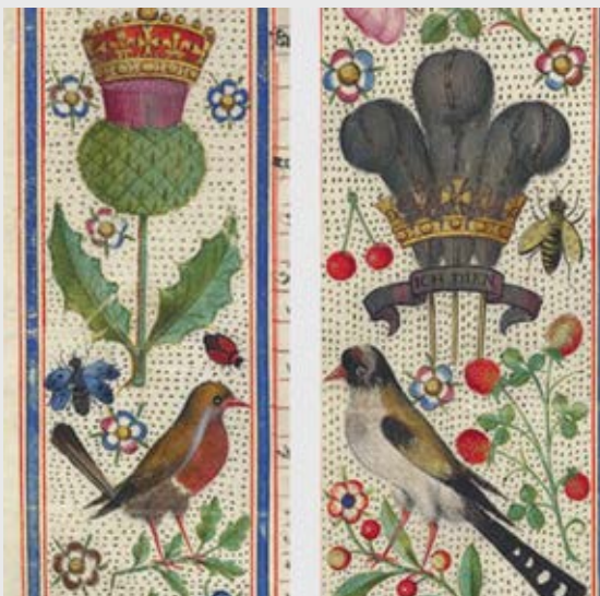
Archivo General de Simancas (Spain): Detalj mirovnog sporazuma Engleske i Španjolske, 18. kolovoza 1604.

Portal će se širiti i poboljšavati u okviru APEX projekta – www.apex-project.eu – kako bi korisnici diljem svijeta mogli u potpunosti iskoristiti njegov potencijal.